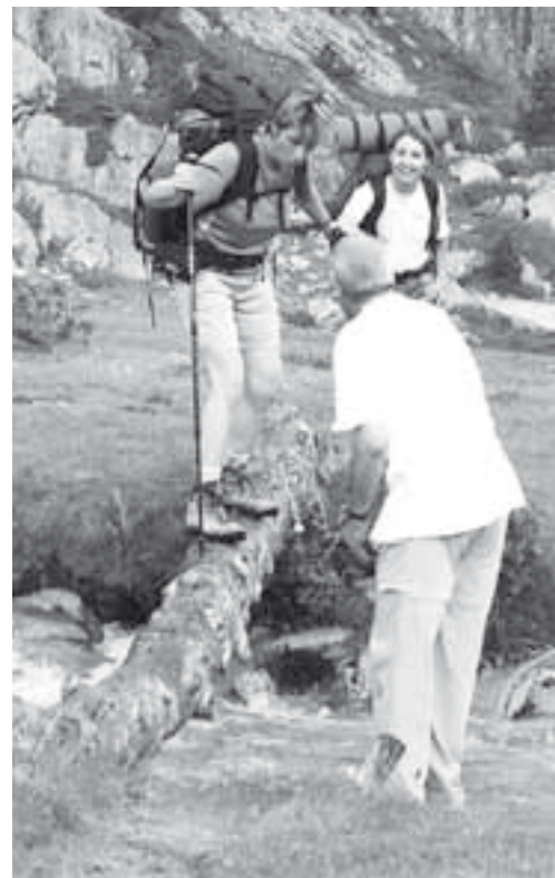
Creuant un torrent

El darrer tram fins arribar a Àreu era de pista, però l'hem fet més ràpid del que ens pensàvem en principi i a més n'hem esquivat tan tros com hem pogut desviant-nos cap a les bordes de la Rebuira. Al càmping ens esperava la benvinguda d'uns companys del Club i hem anat a celebrar l'èxit d'aquest nou estiu de travessa per l'Alta Ruta Pirinenca. Hem tingut el privilegi, un any més, de gaudir d'un ambient fantàstic entre la gent del grup i d'uns paisatges verament impressionants. Només podem demanar tornar a repetir l'experiència l'estiu que ve per anar-nos acostant cada cop més a l'aigua de la Mediterrània, on s'acaba aquest viatge per etapes. ■