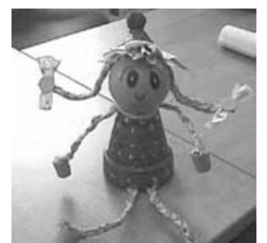
NÚRIA PONS TORRENTS