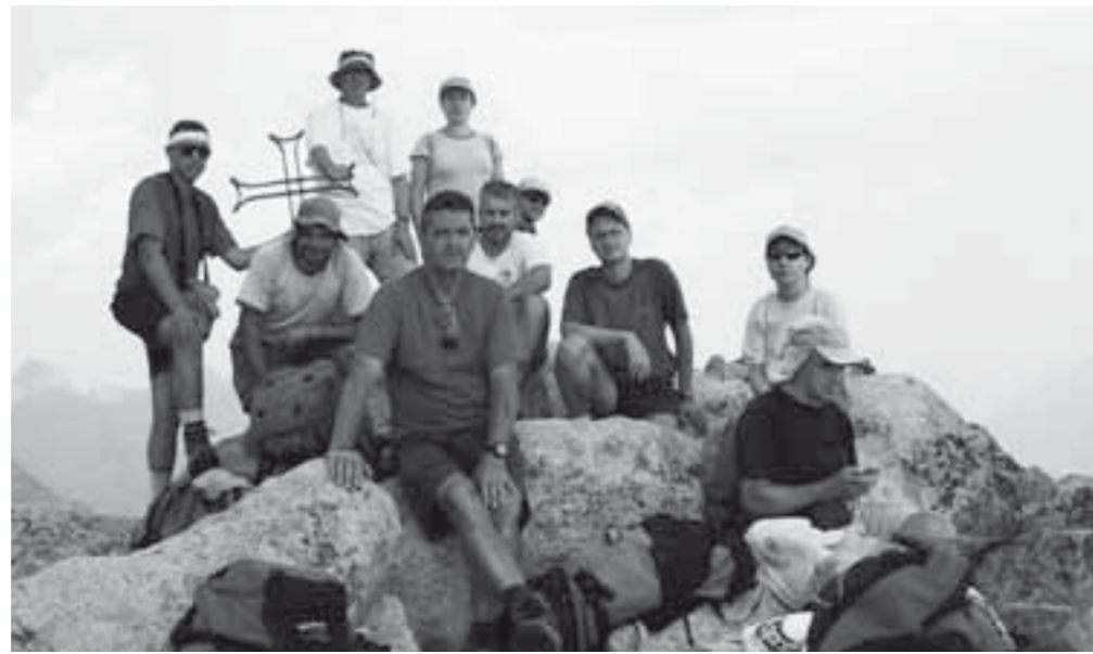
Cim del Tuc de Mulleres