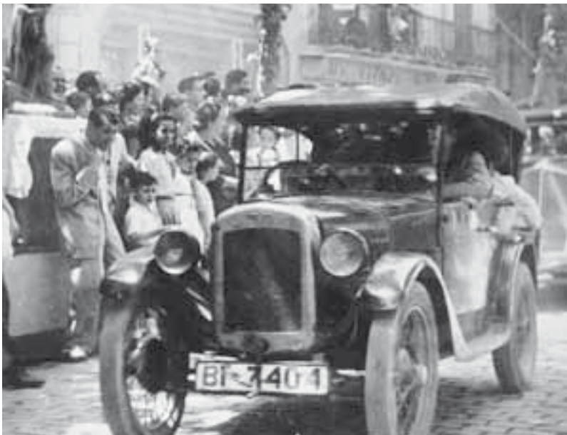
Any 1950 Primers vehicles que van donar servei a Copons