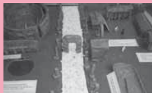
ELISBENJA MERCADAL SEGURA