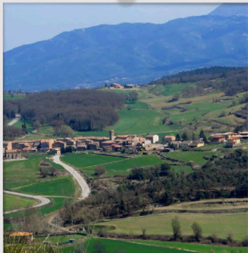
SOM DE COLLSUSPINA